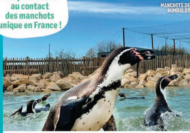
MANCHOTS DE HUMBOLDT