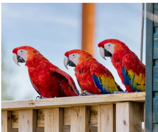
Ronan Rocher – Aras

Les Psittaciformes sont un ordre d'oiseaux tropicaux qui regroupe près de 350 espèces plus connues sous les noms de perroquets, perruches, lorises ou conures. Ces espèces aux couleurs chatoyantes et à l'intelligence reconnue, occupent une pluralité d'habitats sur l'ensemble des continents de l'hémisphère sud, à l'exception de l'Antarctique. Mais près d'une espèce de perroquets sur trois est menacée de disparition à l'échelle du globe, une proportion inégalée dans toutes les autres grandes familles d'oiseaux.